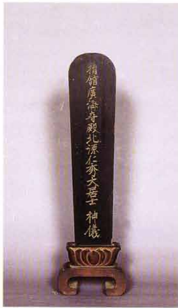
開基 広済寺殿 位牌

（多くの布施を喜捨する有力な檀家）として当寺（釈迦堂）の発展に尽くした人物と考えられる。