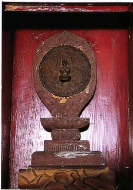
御鏡観音（開山奉持）