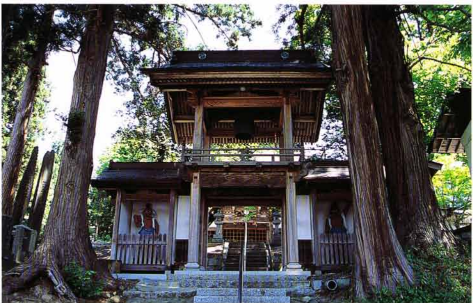
山門（大正八年建立）

当寺には、聖武天皇の御代、天平年間（七二九〜七四八）行基菩薩の作と伝えられる釈迦仏（釈迦如來）を本尊として創建されたとの言い伝えもある。