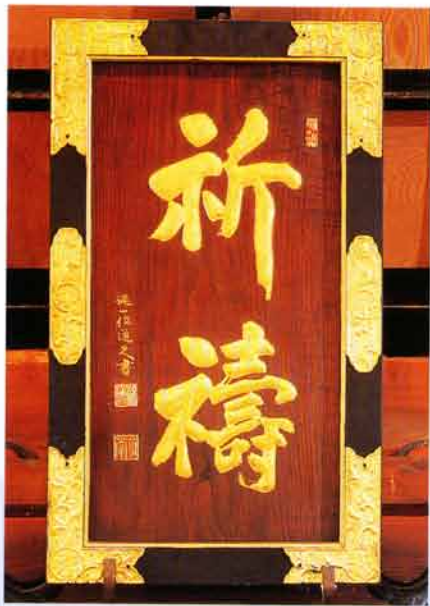
祈禱額（久我通久 書 二十四世代）