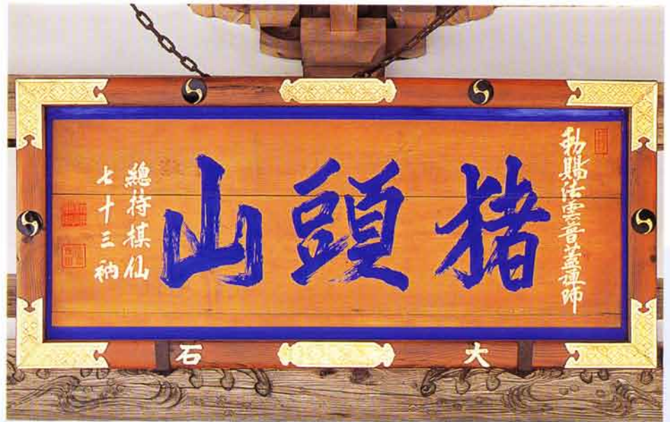
山号額（畔上棋仙禅師 書 二十四世代）