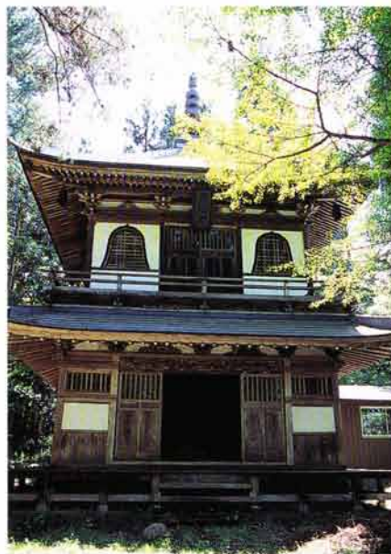
多宝塔（昭和十二年建立）

当寺の旧釈迦堂跡には、昭和十二年建立の二階造り「多宝塔」がある。これだけの威容を誇る多宝塔を持つ仏閣は極めて珍しい。塔の一階には西国秩父坂東の百体の観音が安置され、二階の輪蔵には大藏経が納められている。これだけ多くのまとまった観音や大藏経が安置されているのは県下にもあまり例がなく、貴重な文化財となっている。