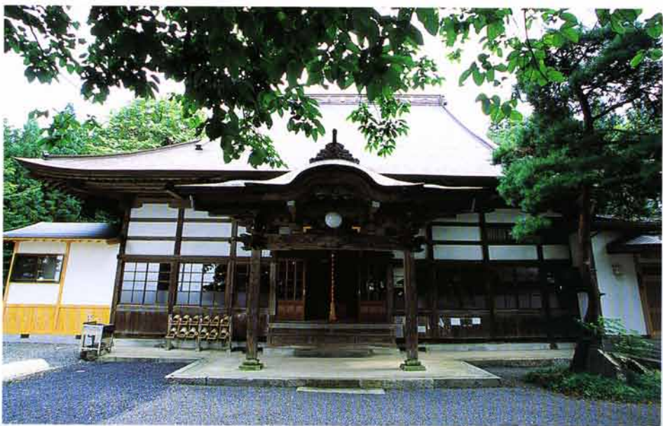
本堂（天明三年建立）

延宝年間（一六七三〜一六八〇）釈迦堂は火災のために大半が焼失してしまった。境内も北上川に近かったことから、洪水で氾濫するたびに被害が出ていた。