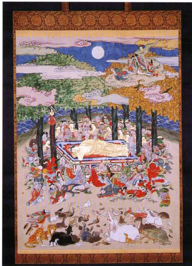
涅槃図（江戸中期狩野派 十八世代）

南部盛岡藩領内でも深刻な飢饉に見舞われ、餓死者や病死者は六万四千人以上にのぼったといわれる。八戸領でも三万人以上が死亡したと伝えられている。土地を捨てて他国へ逃げる領民も続出した。