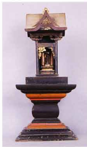
本尊前立 合掌釈迦牟尼佛

当山は清原一族が金沢柵を構築し、その時代に「羽州三十三観音札所」を保昌坊が定めて訪れたとすればその年代、長久三年(二〇四二)に金沢柵大手門下にあり、清原一族の祈禱寺であった。菅江真澄によれば天台宗であり、山号名は「萬歳山」と称したと伝わり、その後、柵の中に金沢八幡宮が源義家が岩清水八幡を勧請して建立され、その別当寺になったという。現在地の「寺の沢」も当寺の寺域であったのか、閑居長根経塚から、経筒の施主に元久三年(二二〇六)の記年銘と源の姓が入ったものが出土している。