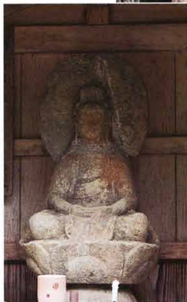
山門左手前 当山三十三観音の一番観音