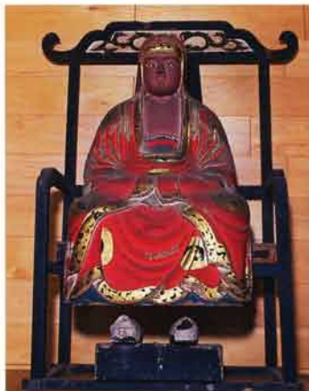
達磨大師(嘉永4・1851施入)

泰道は初めて横手城主となり、横手の明永山大義寺を、開基の藤原正衡の名をとり、曹洞宗大義山正平寺と改宗・再興開基殿となり、小野寺宗家の菩提寺とした。長禄二年(一四五八)のこととされる。一説によるとこの年代には泰道はまだ南部三郎の麾下にあったともいう。