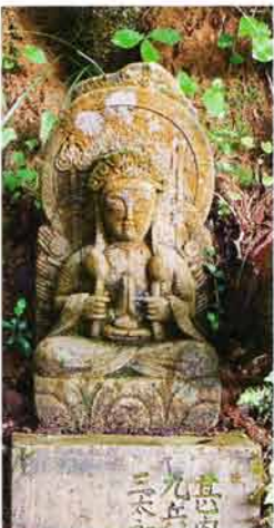
境内南方から金沢古城柵に至るまでに三十二体の観音様が祀られている。天保(1830～43)の頃建立。