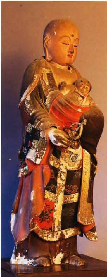
子安地藏菩薩(安政4・1857年)

金乗坊を亡ぼした小野寺一族は代々曹洞宗を外護し、雄勝・平鹿地方に多くの曹洞宗寺院を開山している。 又、金沢城に養子入りした権之助光長の六郷氏代々も曹洞宗で、その菩提寺は龍雲山永泉寺であった。 永泉寺は二階堂系久米氏の出自を持ち、飯詰に生れ、大本山總持寺四世峨山韶領の十六