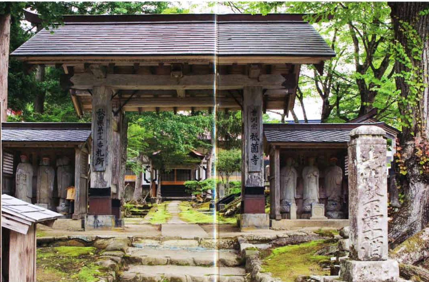
山門:左右に六道能化地藏、右前に「山門禁葷酒碑」が建てられている。