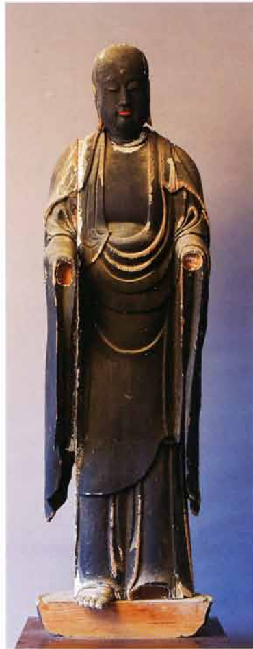
延命地藏菩薩(明治9・1876年施入)