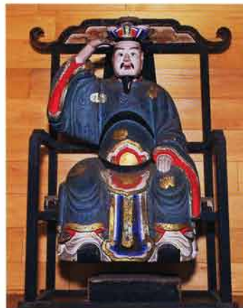
大権修理菩薩(嘉永4・1851施入)