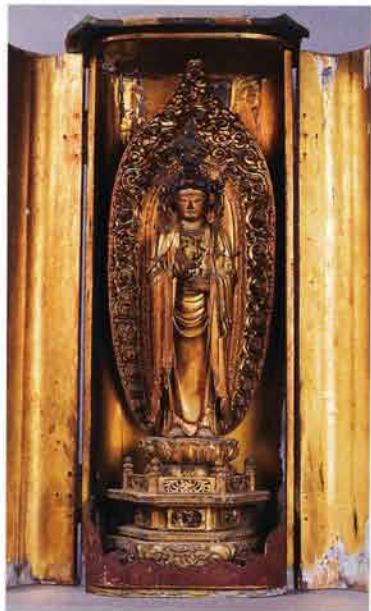
聖観世音菩薩(天保3・1833年施入)

年(一五九四)の『中郡領地上り状』の中に金沢前郷村について、「金沢前郷ノ内 金沢旧領 湊兵庫介殿(六郷政乗) 代官支配之八百式拾参石天下様(秀吉)へ御上納 金沢本領也 六百七