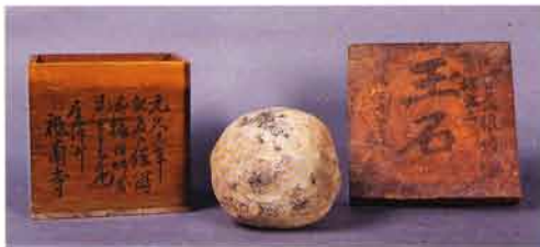
元久3年(1206)銘の経筒の蓋・径10cm(県重文)