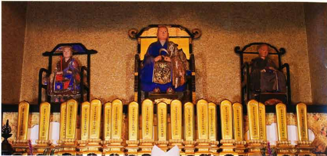
左：太祖常済大師瑩山禪師 中央：開山直翁授性大和尚 右：高祖承陽大師道元禪師。前に歴住の位牌

金沢の城は、慶長七年佐竹義重の六郷入部により、東将監・梶原美濃が受けとり、元和八年(二六二二)廃城となった。小野寺の残党はこの地方に残り、六郷氏や佐竹氏に対してしばしば一揆を起したが最後は「鬼の義重」の異名を持つ佐竹義重に鎮められている。くしくも佐竹の祖は後三年の役でこの地で戦った新羅三郎義光である。金沢氏は六郷政乗に従い臣として府中へ、元和九年(二六三三)本多正純の改易後、六郷政乗は二萬石となり再び出羽の地本荘に居を移した。