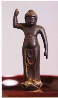
釈迦誕生佛 (明治9・1876年施入)