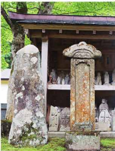
本堂前の無縁塔と地蔵堂