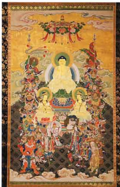
十六善神図(明治9・1876年施入)