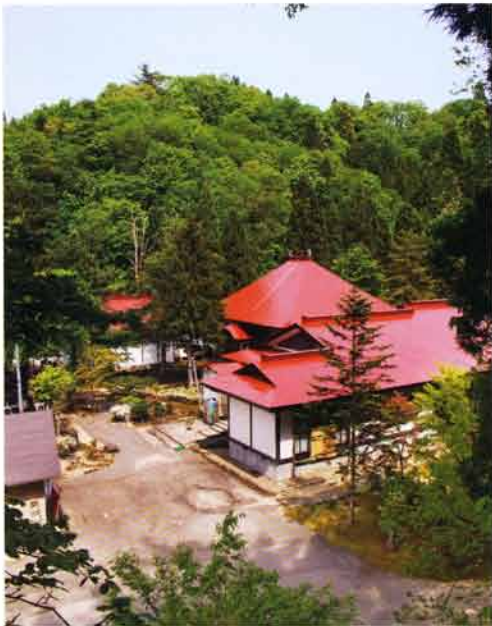
閑居長根経塚群を背景にした本堂

当山の境内の北に老僧が隠居して住んだという閑居屋敷があり、この続きの閑居長根からは二基の経塚が発掘され、経筒と経蓋が三箇見つかつている。その内の一つは、元久三年(一一二〇六)銘のもので、明治四十一年(一九〇八)に発掘され、秋田県有形重要文化財の指定をうけている。石の中央に穴をうち、経筒を入れ、自然石を蓋とした、銅製の経筒で、蓋に和鏡(梅枝蝶鳥鏡)を転用している。高さ二〇・二cm、蓋の径一〇・二cm、針