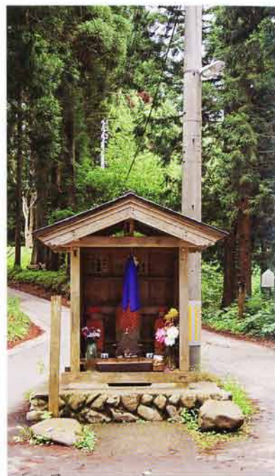
紙園寺入口の地蔵堂