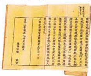
大般若経(貞享2・1685年銘)