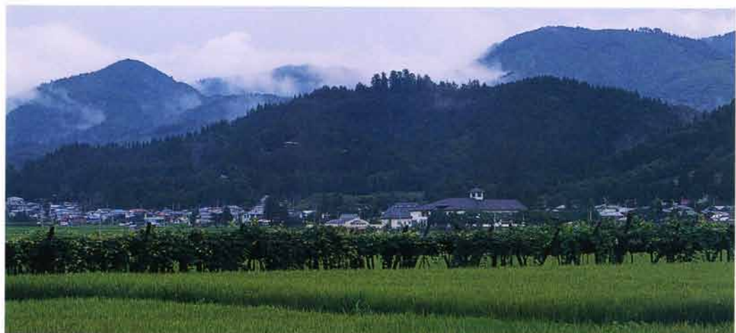
後三年の役で清原一族が立て籠った金沢柵