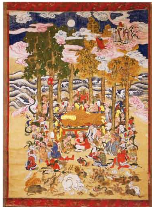
釈迦涅槃図(文政5・1822年作)