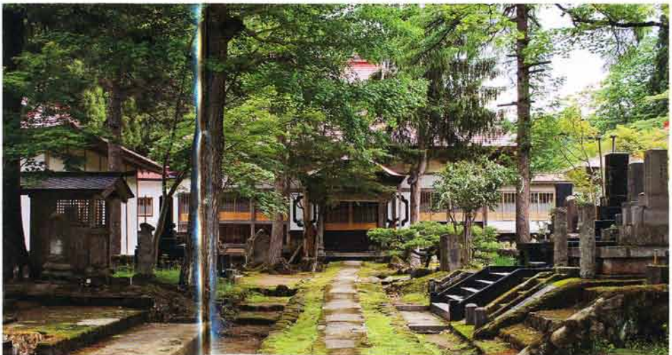
安政2年(1855) 建立の苔むし