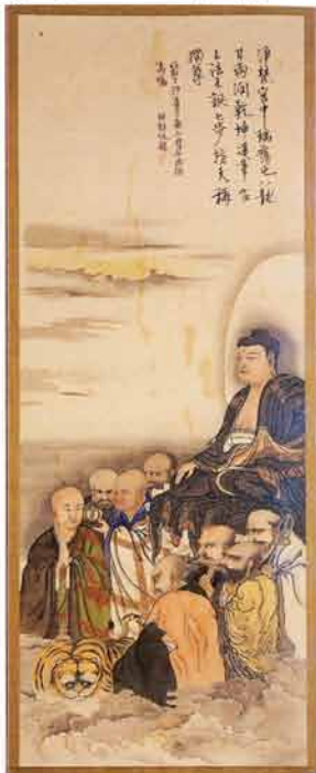
十六羅漢図二幅の一 福寿園南山画(昭和2年作)